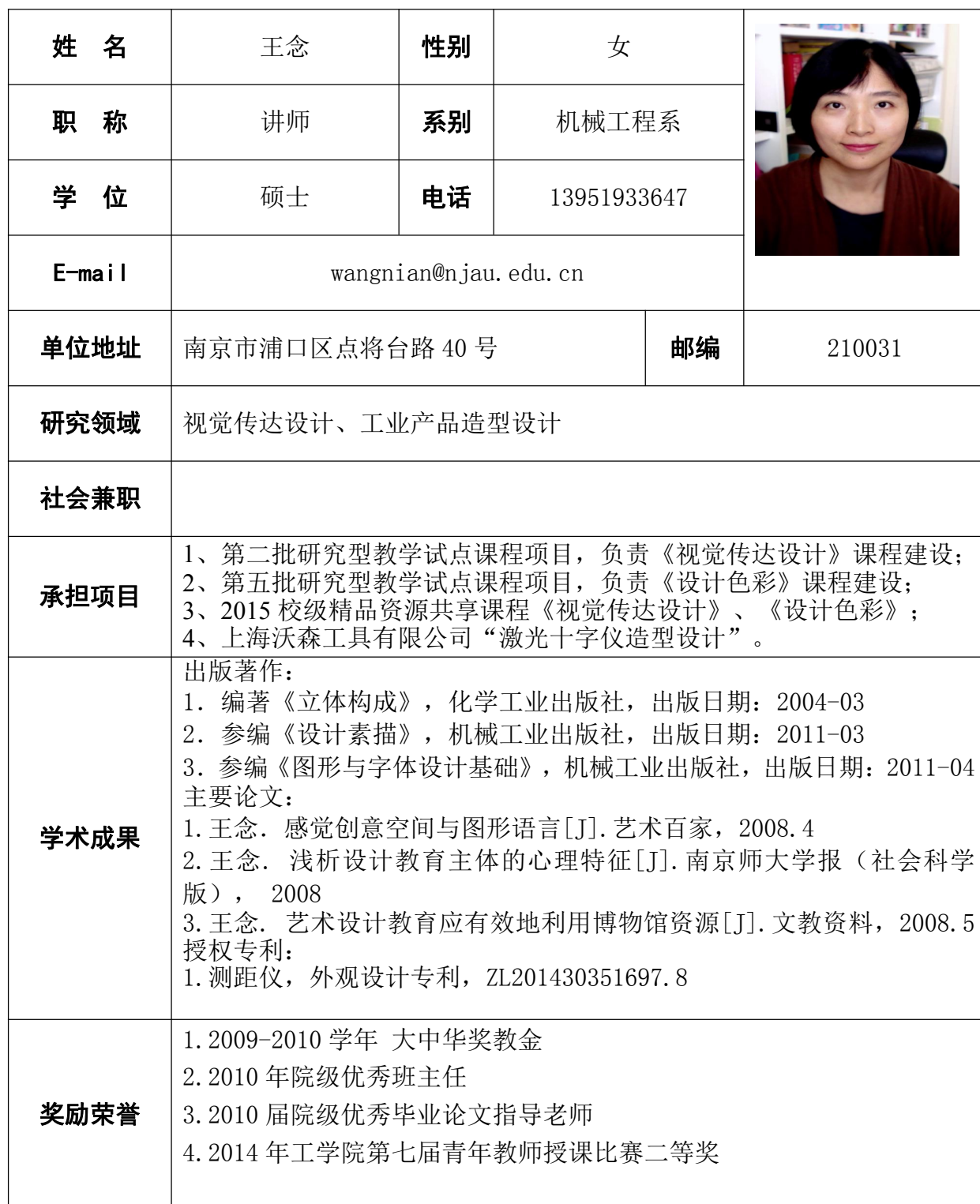
师资队伍/个人信息（样表）